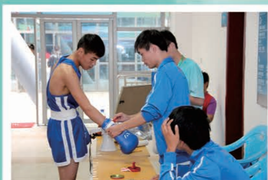
志愿者服务十三届省运会