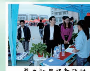
学生社团招新活动