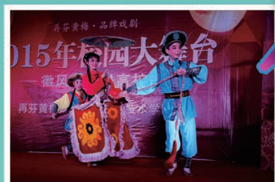
徽风皖韵进校园活动