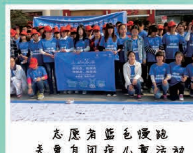
志愿者蓝色慢跑 关爱自闭症儿童活动