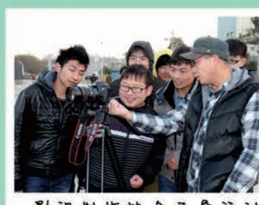
影视制作协会开展活动