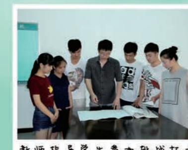
教师指导学生参加挑战杯大赛