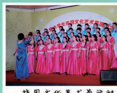
校园文化艺术节活动