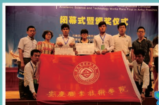
省挑战杯科技学术作品大赛获奖