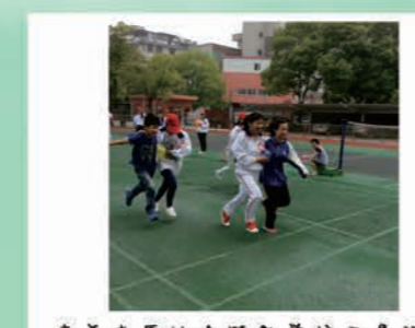
青年志愿者协会开展活动