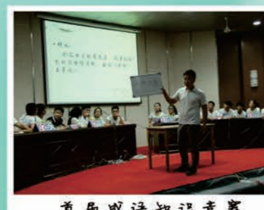
首届英语口语竞赛