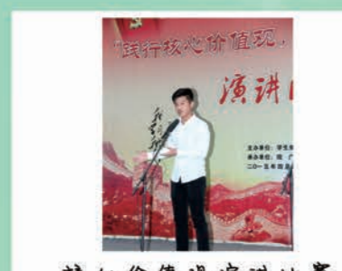
核心价值观演讲比赛