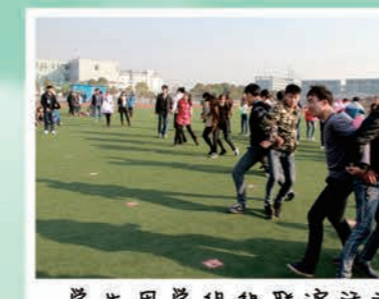
学生团组织联谊活动