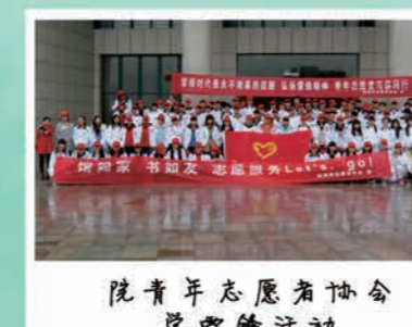
院青年志愿者协会 学雷锋活动