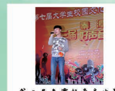
第三届秦潭好声音决赛